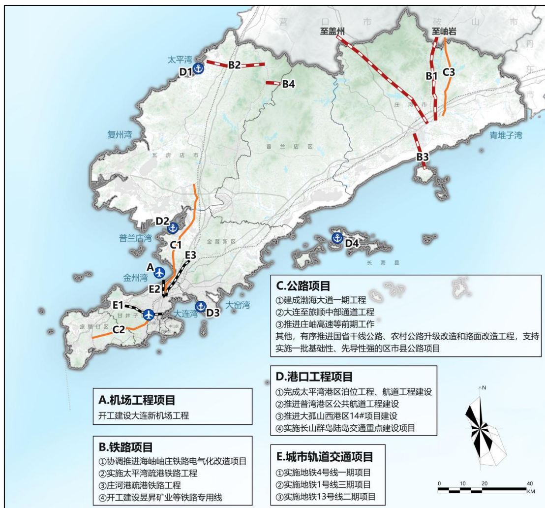
大连综合交通规划示意图