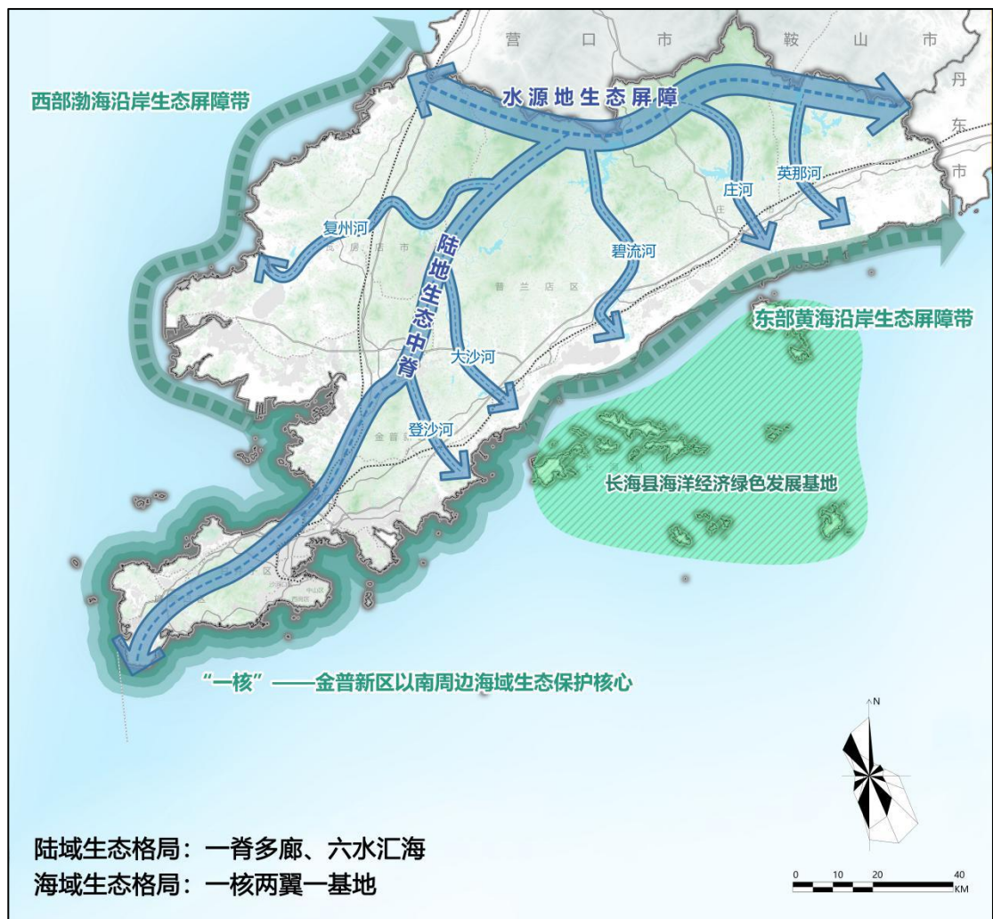
大连市生态空间格局图

开展全域生态保护与修复。严格自然保护区、森林公园、湿地公园、地质公园、文物保护区、永久基本农田等重点生态功能区保护，推动矿山综合整治和地质灾害防治。提升生物多样性保护水平，构建生物多样性监测体系。坚决打击非法捕捉、交易野生动植物，防范新的外来物种入侵。加强海洋生物、野生动植物资源及栖息地生态保护修复。以自然修复为主、人工修复为辅，开展受损生态系统修复。加快蓝色海岸带修复，推进沿海防护林